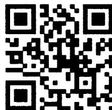
貿易小尖兵 YouTube 頻道

五、本計畫服務窗口：經濟部補助學生赴新興市場實習專案辦公室游經理、葉專員，電話：02-25816286，E-mail： gtp@ieatpe.org.tw 。