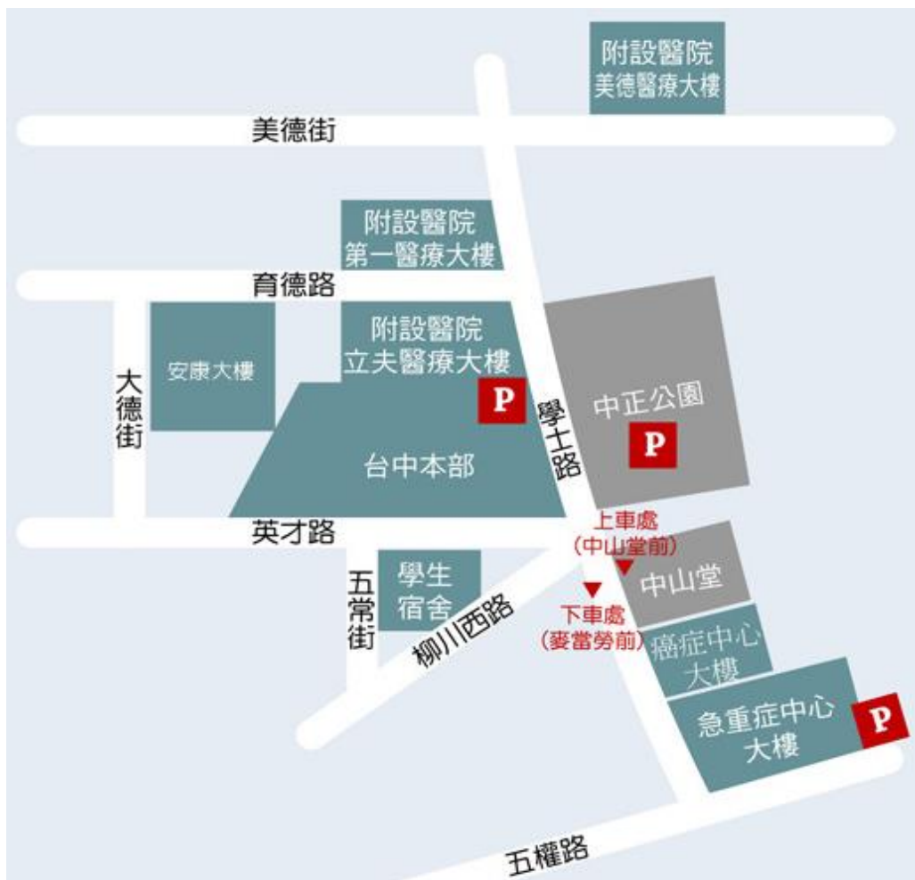
高鐵免費快捷專車－中國醫藥大學站 接駁位置圖 (更多資料請參考： 台灣高鐵轉乘服務資訊 )

97 年 1 月 16 日起高鐵台中站免費接駁專車延伸至本校發車（統聯客運），分別於【台中站 6 號出口 13 號月台】及【學士路「中國醫藥大學」市公車站牌(中山堂前)】上車，車程約 40 分鐘。搭車位置可參考下圖：