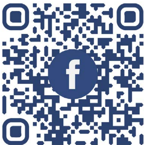
計畫 FACEBOOK 網頁連結