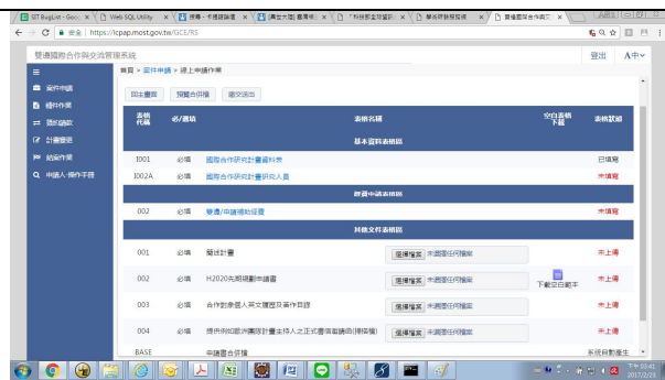
8. 相關表格資料後，即可點選預覽合併檔或直接繳交送出